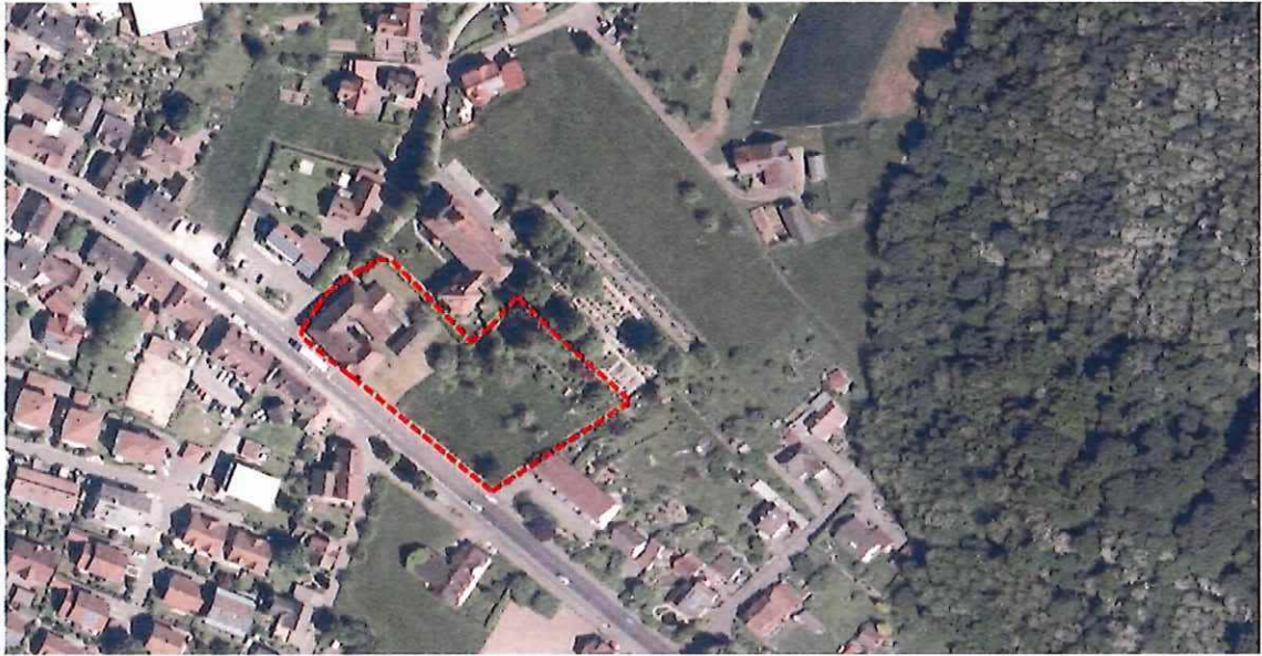
Abbildung 1: Auszug Luftbild, Quelle: Daten- und Kartendienst der LUBW